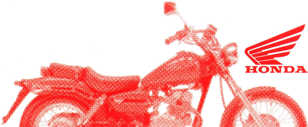
ST 50 Dax Fahrtwindgekühlter Einzylinder-Viertaktmotor, 49 cm 3 , 1,8 kW (2,4 PS) bei 7.000 min -1 , 3,0 Nm bei 4.500 min -1 , Sitzhöhe 740 mm, 2,5 ltr Tankinhalt, Trockengewicht 72 kg