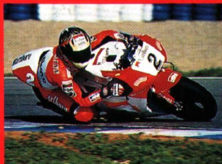
Vizeweltmeister Grand Prix '97 250 cm 3 Ralf Waldmann

Denn Mobilität ist ein Anspruch unserer Gesellschaft. Ein Anspruch, an dem sich das umfangreiche Honda-Motorrad-Programm messen lassen muß. Und es erfüllt ihn. Mit einer Modellstrategie, die perfekt auf die Bedürfnisse des anspruchsvollen Motorradfahrers ausgerichtet ist und diesen in jeder Beziehung gerecht wird.